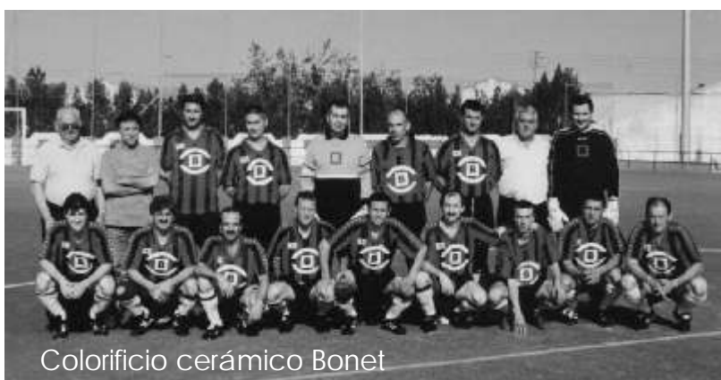
Colorificio cerámico Bonet