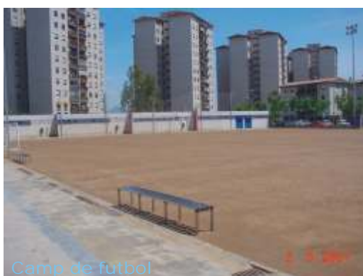
Camp de futbol