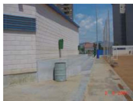
Graderia del camp de futbol